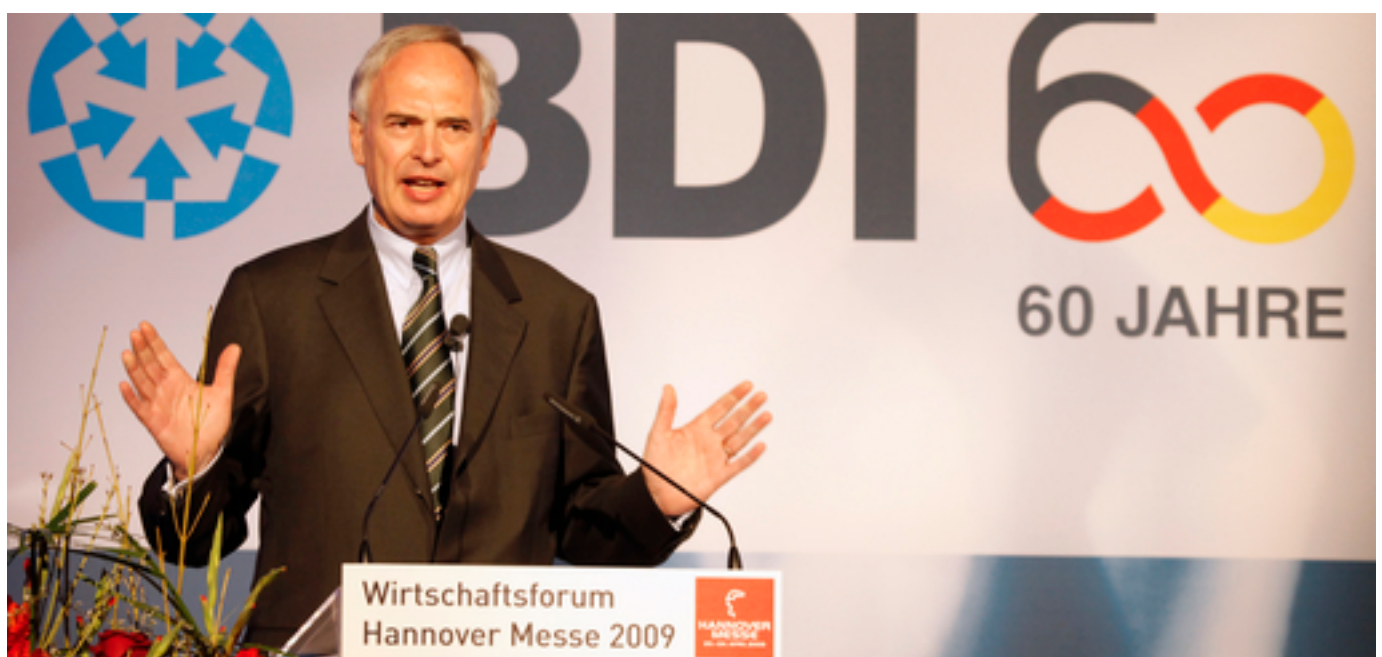
BDI-Präsident Hans-Peter Keitel auf dem Wirtschaftsforum Hannover Messe 2009 »Echte Werte - Industrieland Deutschland« im April.