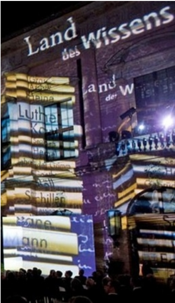
Festlicher Abend der deutschen Industrie im Januar 2009 im Deutschen Historischen Museum.