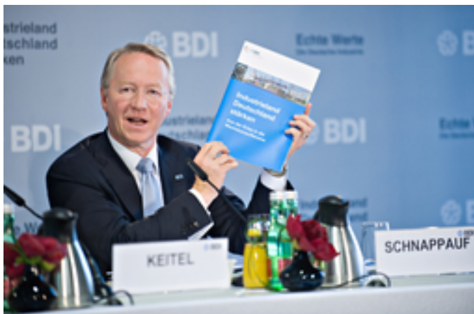
BDI-Hauptgeschäftsführer Werner Schnappauf präsentiert die Publikation »Industrieland Deutschland stärken« auf dem BDI-Tag der Deutschen Industrie 2009 im Juni.