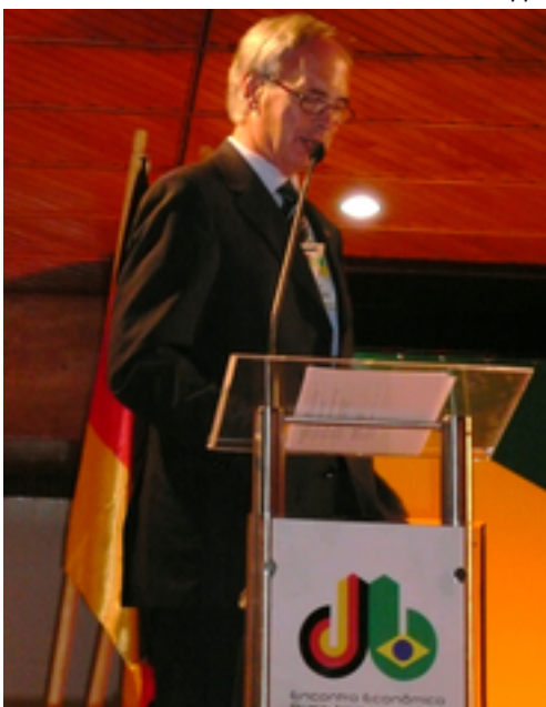
BDI-Präsident Keitel auf den Deutsch-Brasilianischen Wirtschaftstagen in Brasilien.