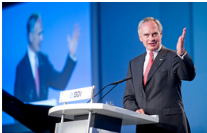
BDI-Präsident Hans-Peter Keitel auf dem BDI-Tag der Deutschen Industrie.